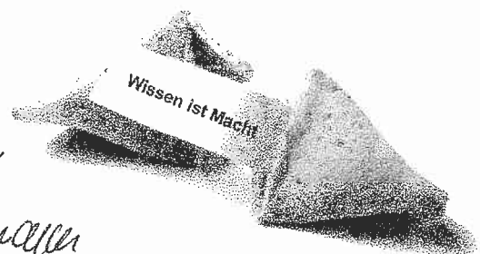
advopro GmbH 04.09.2015