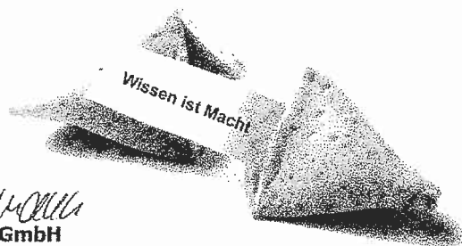
advopro GmbH 21.01.2012